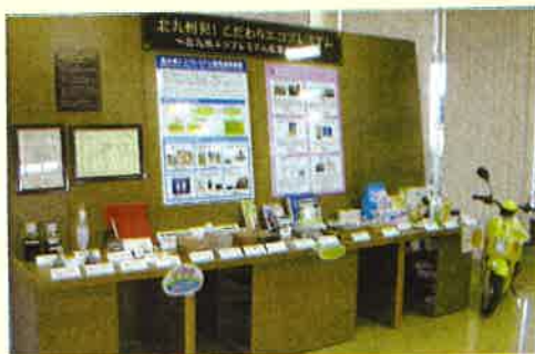
エコタウンセンター(若松区向洋町)