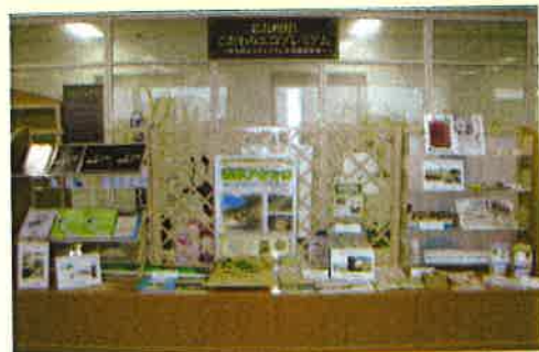
消費生活センター(戸畑区汐井町ウエルとはた7階)