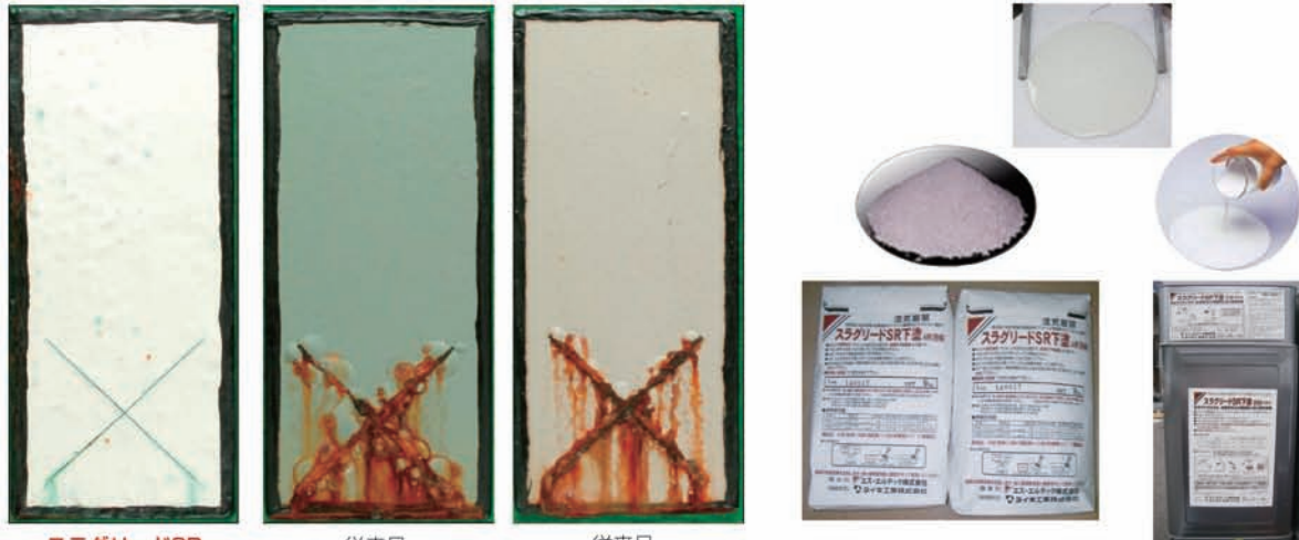
スラグリードSR 従来品 (アルカリ塗料) 従来品 (エポキシ樹脂系塗料)